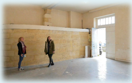
Entrée actuelle de Pelleport

Pour en revenir aux locaux de la rue Broca, les activités ne pourront s'exercer que dans les deux salles présentant des normes sanitaires satisfaisantes : l'une, qui donne sur la rue Paul Broca, et l'autre, attribuée aux activités sportives. Les salles sans possibilité de renouvellement d'air ne seront plus utilisées.