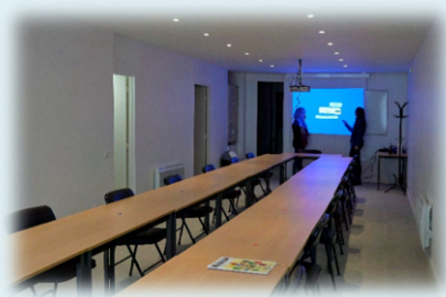
Salle de Causserouge

La première acquisition, qui se situe 9 rue Causserouge, a nécessité de lourds travaux. Les consignes sanitaires font que cette salle n'a, pour l'heure, été que peu utilisée. L'autre bâtiment se trouve 266 rue Pelleport et il est en cours de réaménagement. Une fois restructuré, il comprendra une très belle entrée avec des murs en pierres apparentes, une première salle de petite taille pouvant recevoir en temps normal jusqu'à 10 personnes. À l'arrière se trouvera une pièce assez spacieuse qui, avec la mise en place d'une ventilation mécanique, pourra accueillir des cours de gymnastique, de danse, et plus largement d'arts de la scène. Enfin, deux espaces destinés aux vestiaires compléteront l'ensemble. Ce lieu sera proposé aux étudiants dès la rentrée 2021-2022. Pour cette acquisition, l'UTL a préféré emprunter une somme de 440 000 euros, afin de préserver un fond de trésorerie pour continuer à faire face, le cas échéant, aux aléas d'une poursuite de la crise sanitaire.